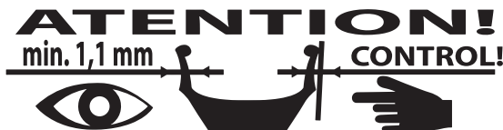
KONTROLUJTE STĚNY RÁFKŮ