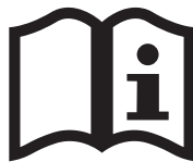
PŘEČTĚTE SI NÁVOD