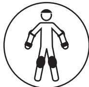
POUŽÍVEJTE OCHRANNÉ PROSTŘEDKY

Na koloběžce doporučujeme jezdit pouze v pevné obuvi.